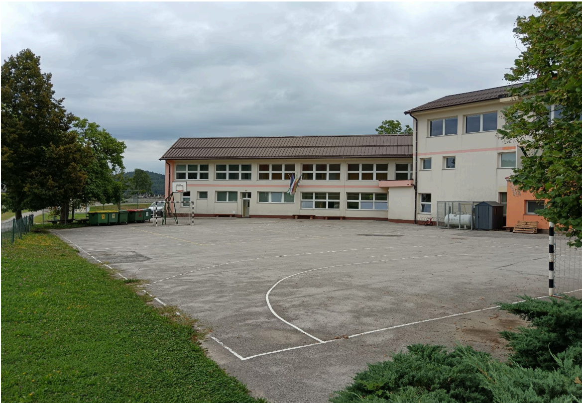
Športno igrišče pri OŠ Šentjanž pred prenovo