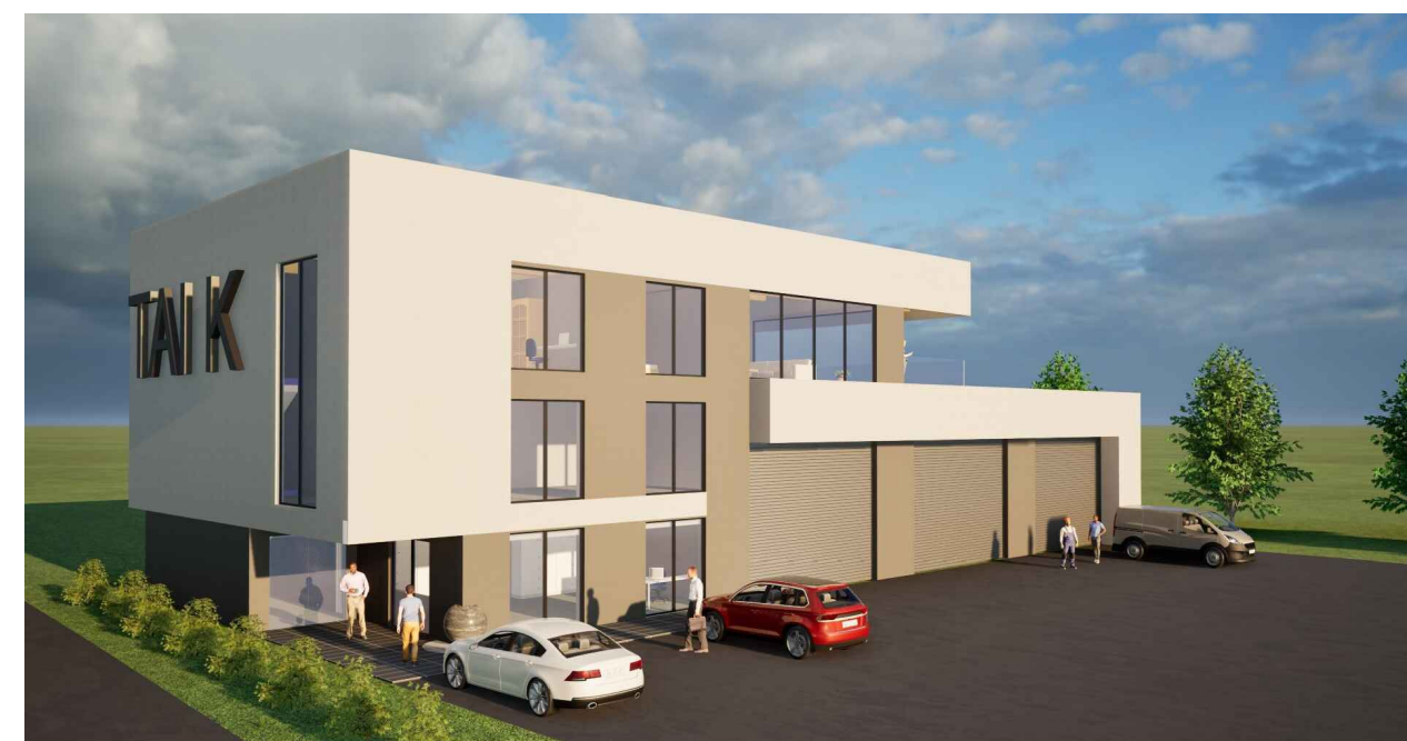
VIZUALIZACIJA PROSTORSKE UREDITVE